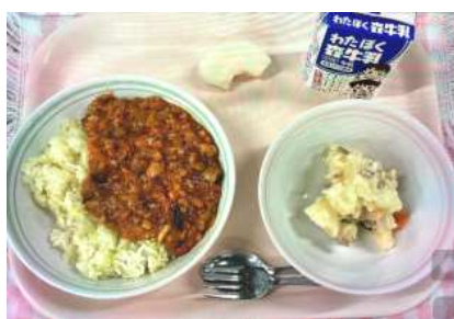
8月26日 三鷹なすのドライカレー、ポテトサラダ、梨