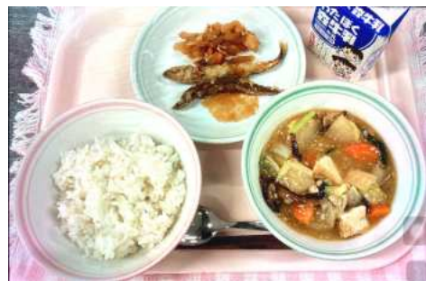
9月4日 玄米御飯、ししゃもの和風ドレッシングかけ、ひきな炒り、冬瓜のそぼろ似