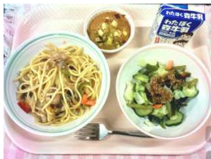
9月1日 和風スパゲティ、抹茶蒸しパン、海藻サラダ、胡麻じゃこドレッシング